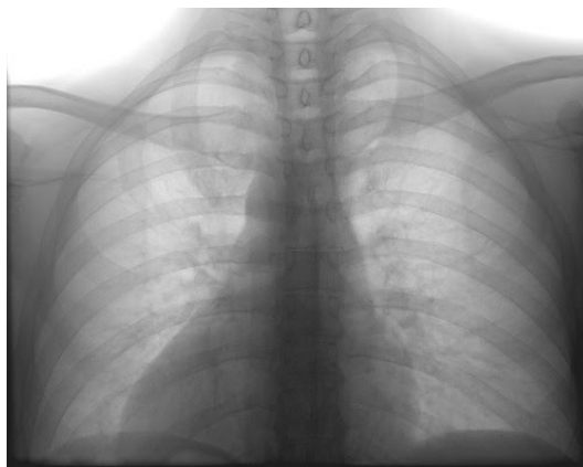
Figure 2: 白黒反転